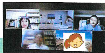
評価員と団体のやり取りの様子▶

今後、活動していく中でもコロナの影響で思うように活動ができないことがあるかもしれませんが代替案を実施するなど、実りのある活動となることを期待しています。